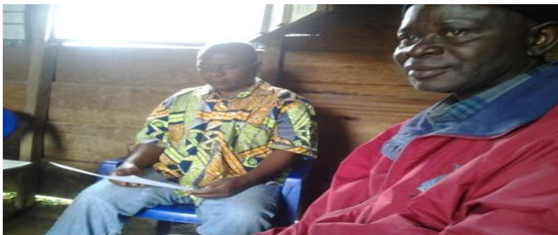
Echange avec l'inspecteur de l'environnement en Territoire de Walikale à Kibua (le 12/10/2013)