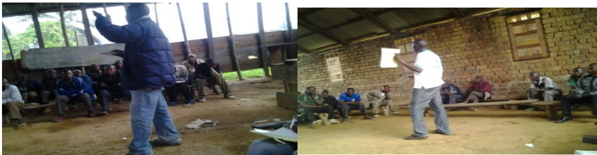
Des séances de sensibilisation dans les villages touchés