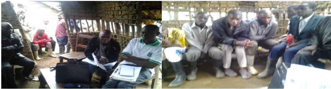
Equipe de facilitation de la Sensibilisation des communautés locale à Kibua, le 09/10/2013